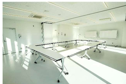
2室通し利用の場合