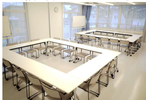
会議室2室通し利用の状態