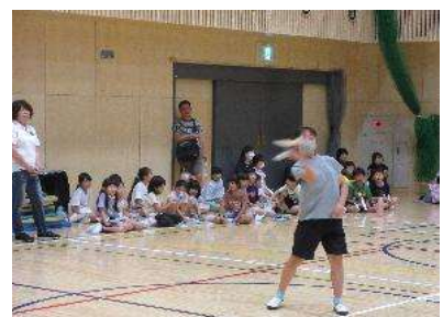
小学校体育館で予選会