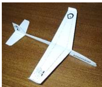
完成した紙ヒコーキ